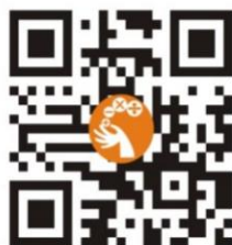
中華數學協會官網