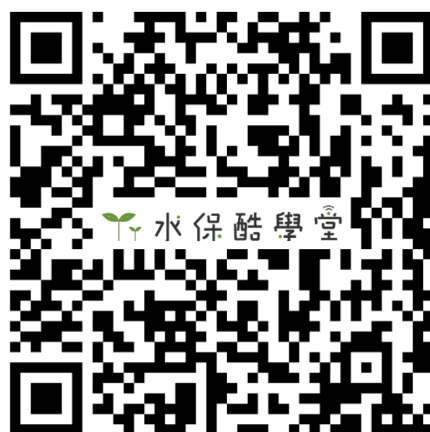
（水保酷學堂網址 QR Code）