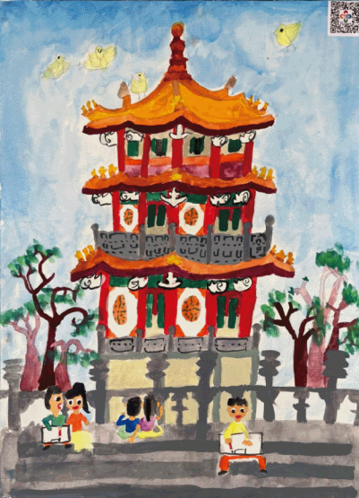
▲ 國小組【第一名】台北市忠孝國小 王睿觀