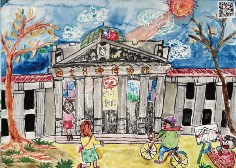
▲ 國小組【第三名】新北市溪洲國小 林苙希