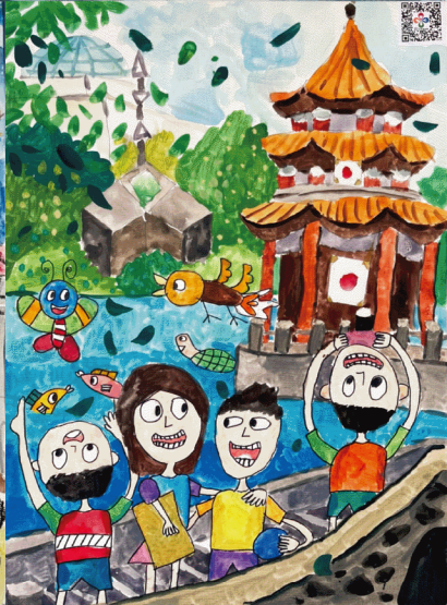
▲ 國小組【第二名】新北市泰山國小 戴子翔