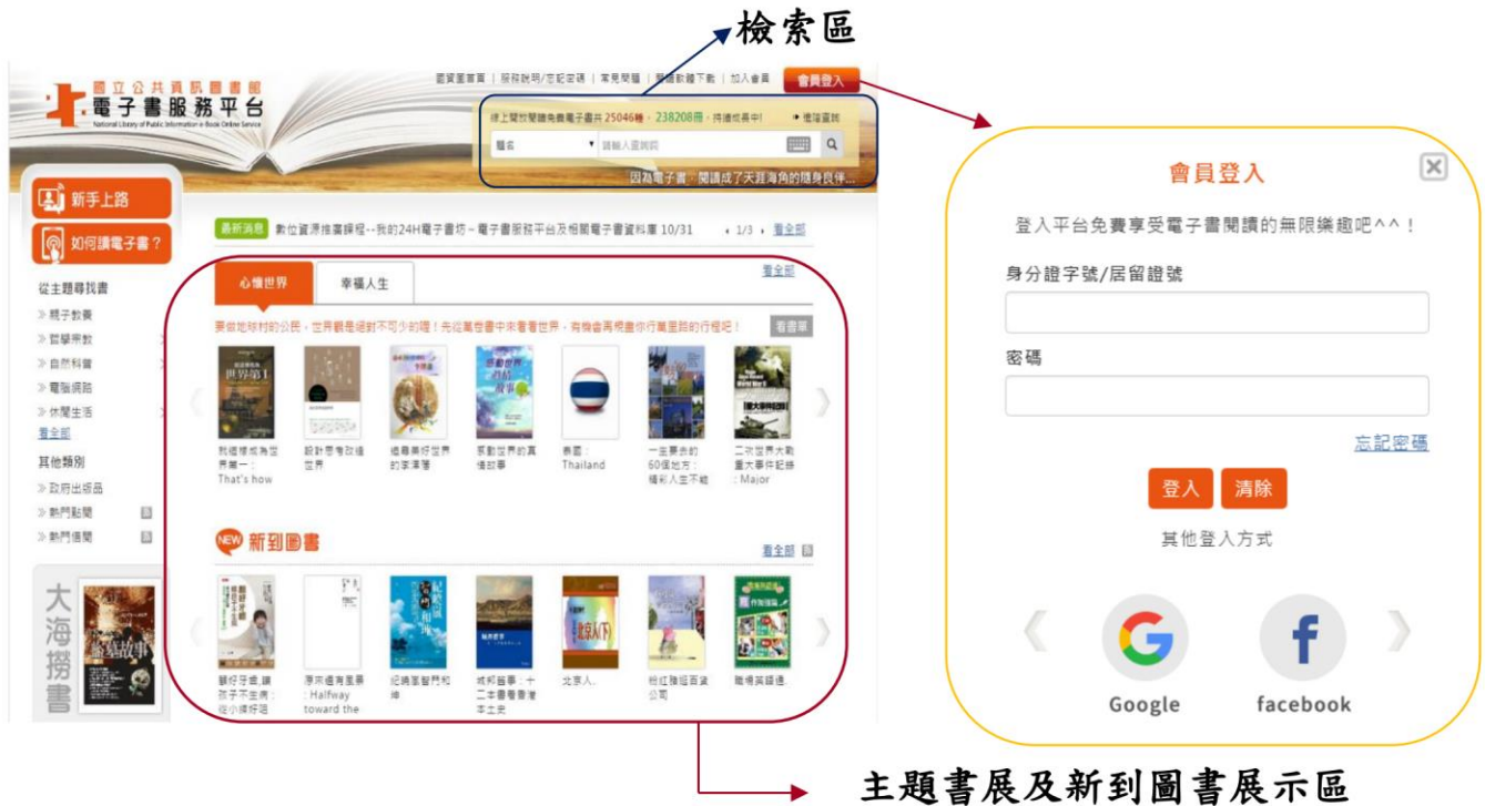
主題書展及新到圖書展示區