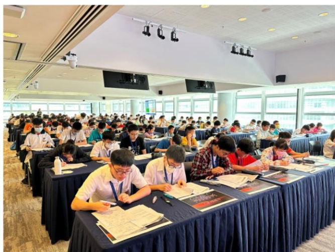
※2023 年 GMEC 總決賽現場