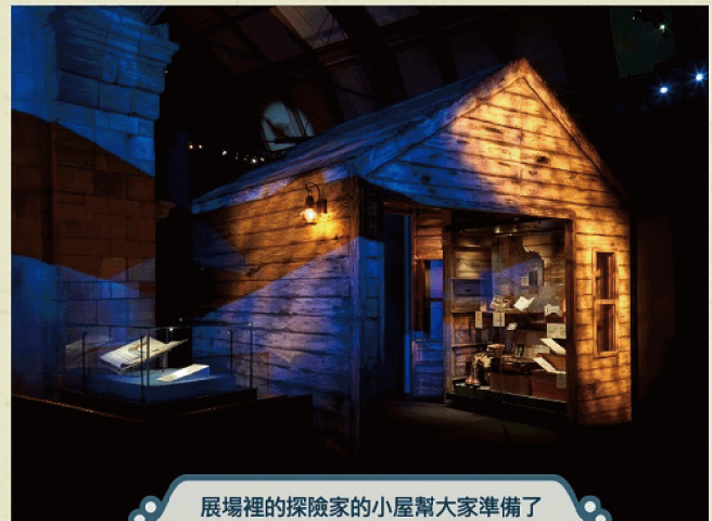
展場裡的探險家的小屋幫大家準備了各式各樣的裝備，大家一起來探險吧。