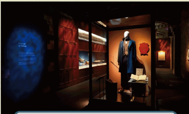
「怪獸與大自然的奇幻世界」特展將於今年暑假強勢登場英國展出內容完整移師來台，不容錯過。