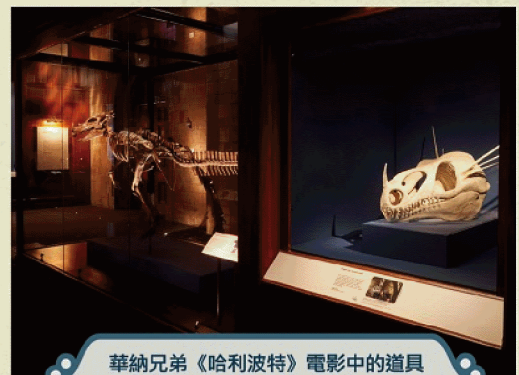
華納兄弟《哈利波特》電影中的道具與現實世界中的文物並陳展示