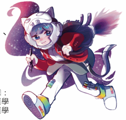
人物繪圖： 高于涵同學 黃仲堃同學