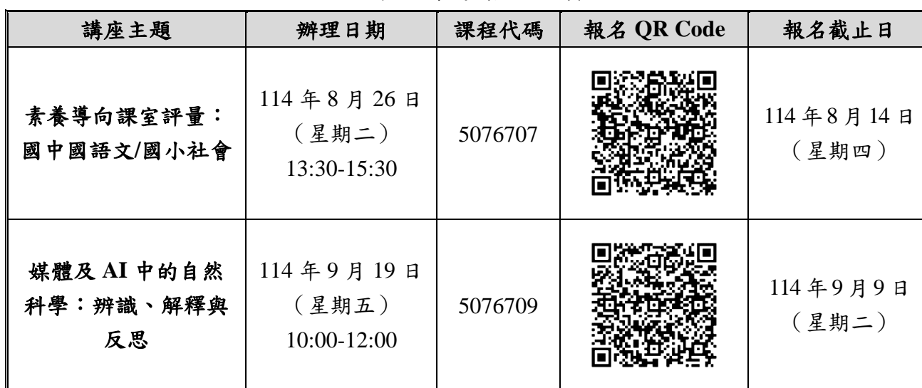
表 2 專題講座報名資訊