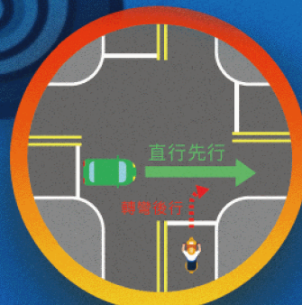
轉彎時 讓直行車先行