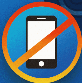
保持專注 遠離手機