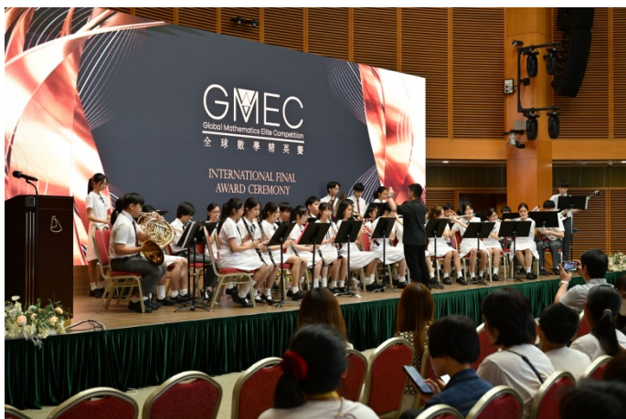
※2025 年 GMEC 頒獎典禮現場