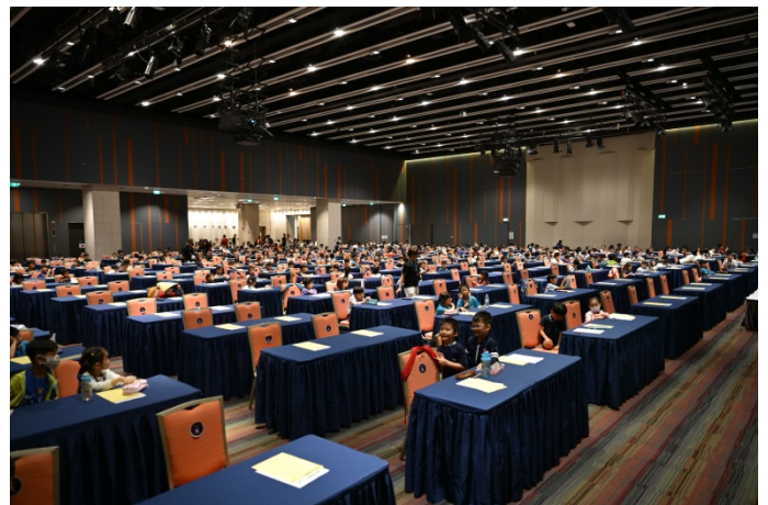
※2025 年 GMEC 總決賽現場